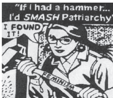
“Si tuviera un martillo, machacaría al patriarcado. ¡Lo he encontrado!”

Sin embargo, una semana más tarde, cuatro estudiantes fueron detenidas/os en la puerta de sus casas. Según el diario El País (18 de marzo), algunos/as de los/as activistas “hicieron fotos [...] y algunas imágenes aparecieron en medios digitales, lo cual facilitó” el que la Brigada Policial de Información de la Policía Nacional les identificara y detuviera (a pesar de no haber recibido denuncia alguna del capellán de la Pastoral Universitaria), acusadas/os de un delito contra los sentimientos religiosos, penado con hasta seis años de prisión. Consideramos oportuno citar una reflexión de unos/as compañeros/as acerca de los límites y los peligros de “ciertas prácticas de los medios de contrainformación que, lejos de ayudar a la lucha, pueden acarrear serios problemas para la seguridad e integridad de lxs compañerxs. Cuando se pone la espectacularidad, la fotito y el inmediatez del minuto y resultado por encima de la seguridad de lxs demás, se está más cerca del periodista que del compañerx” (publicación Ruptura , nº 5, diciembre de 2009).