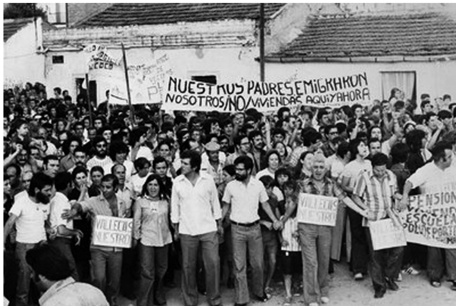
Vecinos/as del barrio vallecano de Palomeras

En 1930, ante una subida brusca de los alquileres, se inicia espontáneamente una huelga de alquileres en el barrio