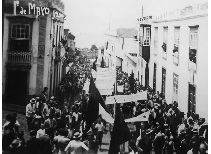
Huelga de alquileres en Santa Cruz de Tenerife en 1933

de Barceloneta, que se extiende rápidamente a otros barrios. El trasfondo de la movilización es vecinal y asambleario. En 1931, ya durante la Segunda República, un grupo del Sindicato de la Construcción de CNT crea la Comisión de Defensa Económica (CDE), que se centra en el asunto de la vivienda y de los alquileres. La manifestación del Primero de mayo de ese año es convocada por el sindicato anarquista en la ciudad bajo el lema “contra el paro, la inflación y por la rebaja de los alquileres”.