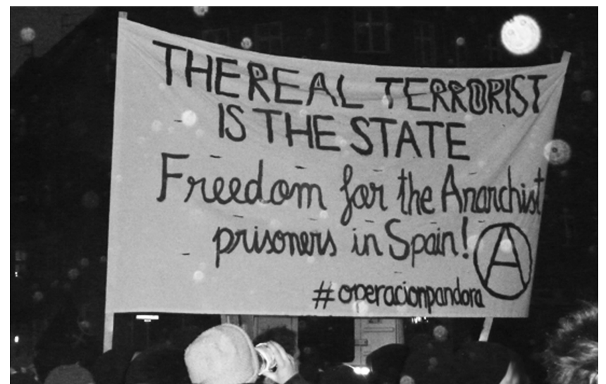
Acto de apoyo a los/as presos/as en Finlandia