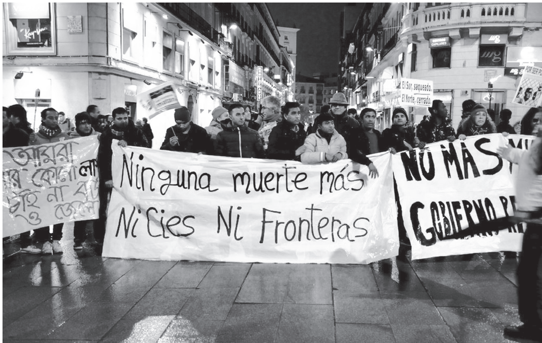
Manifestación en Madrid el 12 de febrero

Como decíamos, a pesar de las labores de ocultación de pruebas y manipulación de lo sucedido por los responsables policiales con la ayuda del Ministro de Interior, lo ocurrido en la frontera de Ceuta el 6 de febrero se ha ido conociendo y no deja lugar a dudas. Hemos podido ver vídeos en los que guardias civiles, al grito de “¡vamos, cabrones!” disparaban pelotas de goma a las personas que intentaban acercarse a nado a la playa ceutí de El Tarajal y hemos tenido la oportunidad de conocer el relato de los/as que ese día escaparon a la muerte, pero regresaron a Marruecos, desde donde seguramente intentarán otra vez cruzar los muros.