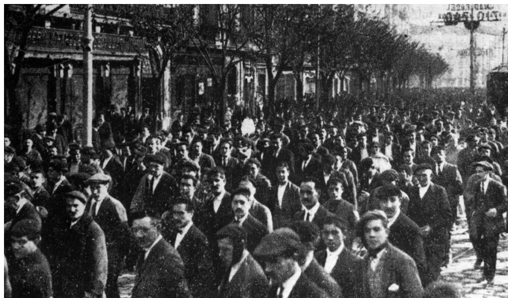
Huelguistas en Barcelona en 1917

Sabemos que son tiempos distintos, que las huelgas salvajes con las que hace tiempo terratenientes, industriales y gobernantes tenían pesadillas parecen ya muy lejanas y que se ha perdido ese espíritu combativo que consiguió que las condiciones laborales que tenemos en estos momentos sean bastante mejores que las que los/as de arriba desearan que fueran. Pero también sabemos que la Historia nos ha enseñado que es peleando como se consiguen las victorias, que a los/as trabajadores/as nunca nos van a regalar nada y, que si se lo permitimos, los recortes, los despidos, el aumento del coste de nuestra vida que estamos sufriendo será sólo el principio. Porque sabemos que ellos/as son insaciables y por ello hay que plantarles cara, porque tenemos claro que la lucha es el único camino .