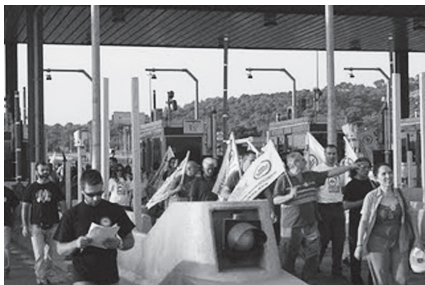
Apertura de peajes

Frente a las subidas de impuestos y la extensión de nuevas tasas ha nacido el movimiento Den Pliróno (No pago). Mediante acciones de desobediencia civil y alejados/as de formas de organización burocráticas demuestran que ellos/as no van a pagar la crisis.